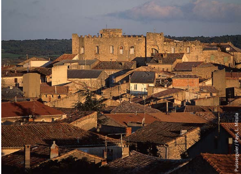
Puisserguier / Pays, L. Micola