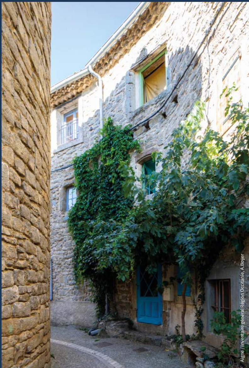
Aigne / Inventaire général Région Occitanie, A. Boyer