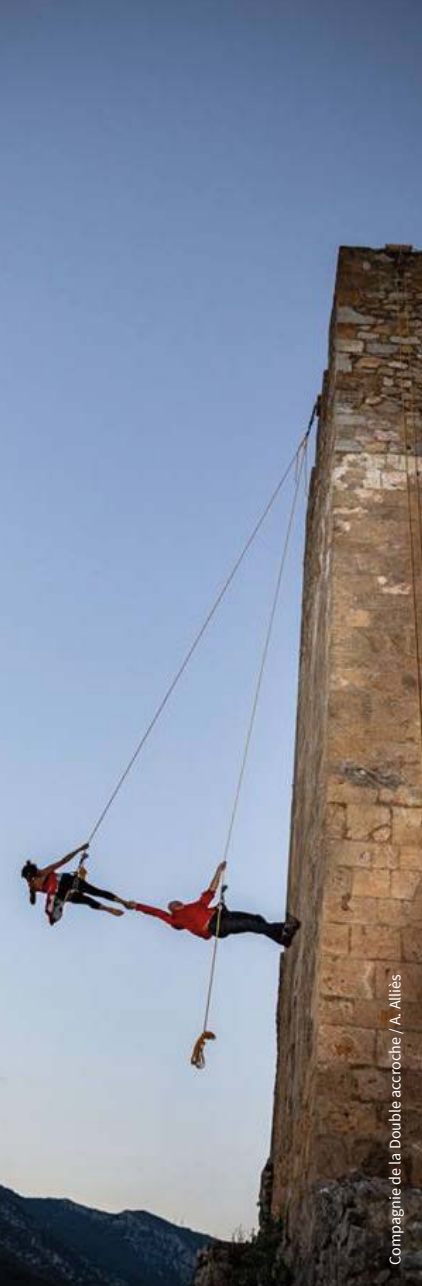
Compagnie de la Double accroche / A. Alliès