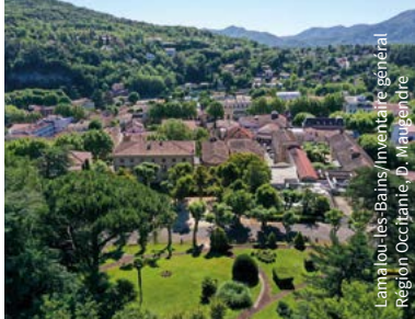
Lamalou-les-Bains / Inventaire général Région Occitanie, D. Maugendre