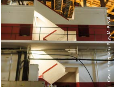
Cave d'Hérépian / Pays, M. Bassil