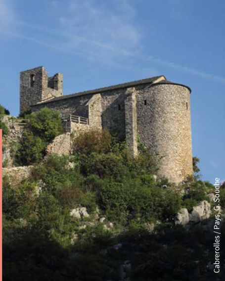
Cabrerolles / Pays, G. Souche