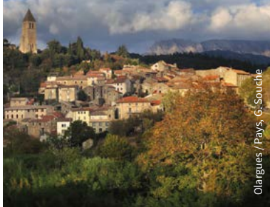
Olargues / Pays, G. Souche