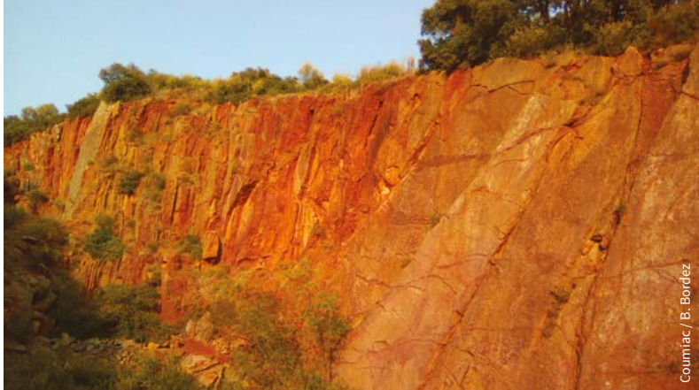
Coumiac / B. Bordez