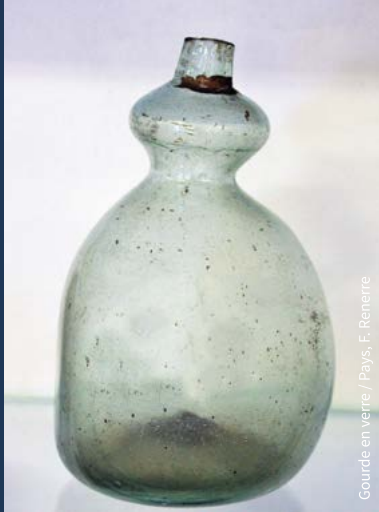
Gourde en verre / Pays, F. Rennerre