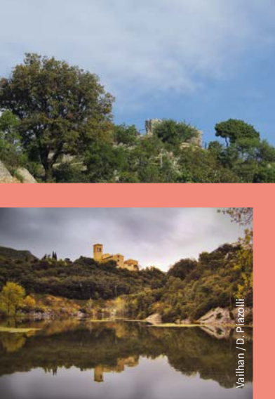
Vailhan / D. Piazzoli