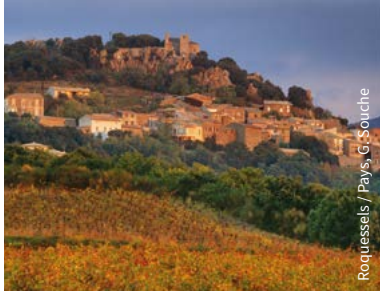
Roquesseles / Pays, G. Souche