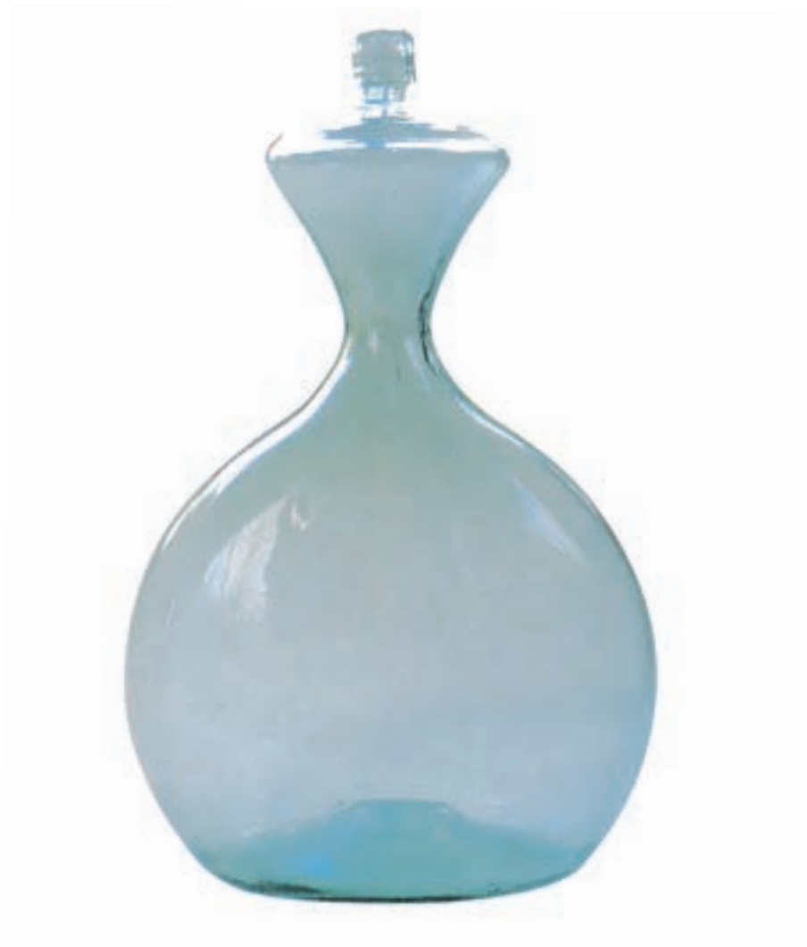
BOUTEILLE DE BERGER