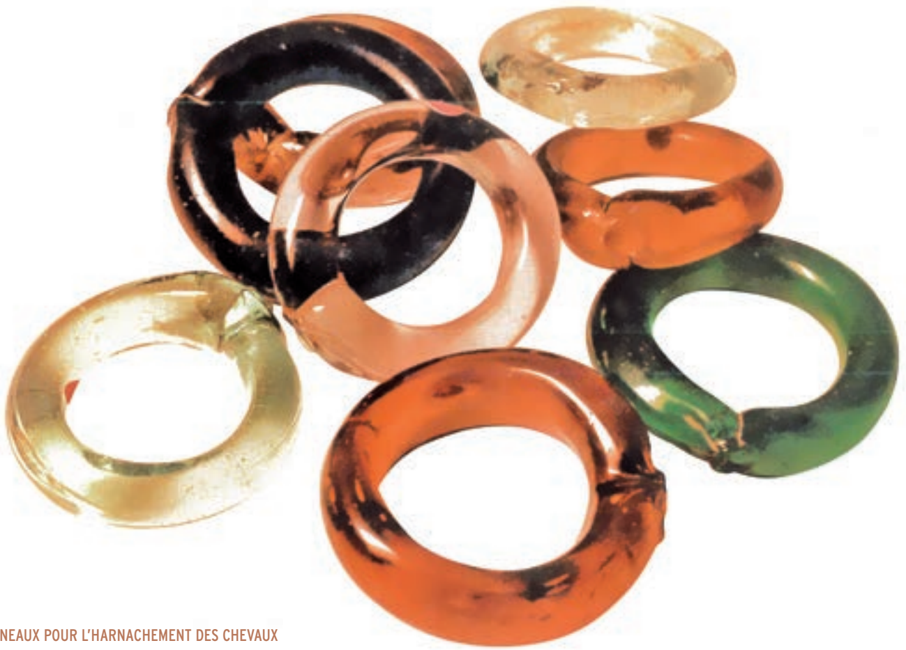
ANNEAUX POUR L'HARNACHEMENT DES CHEVAUX