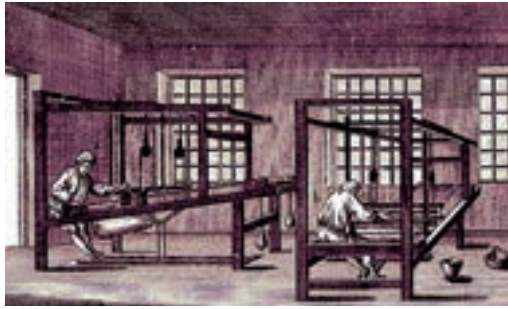
© L'Encyclopédie de Diderot et d'Alembert