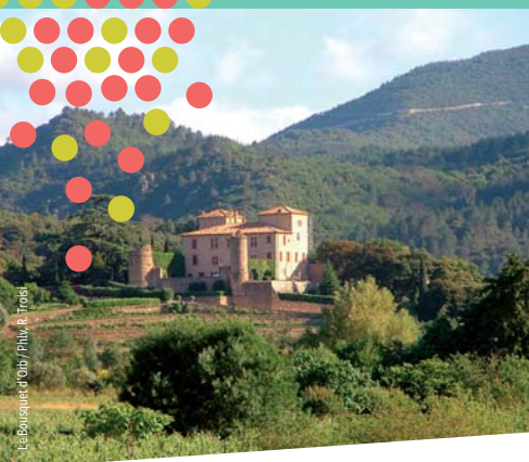
Le Bousquet d'Orb